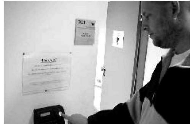
Ein Finger Print Scanner macht Schlüssel überflüssig

Da existierende Systemlösungen am Markt nur über sehr eingeschränkte Funktionalität verfügten, galt es einen neuen Weg zu gehen. Entstehen sollte ein verteiltes System, das von mehreren Administratoren gewartet und in voneinander unabhängigen Organisationseinheiten betrie-